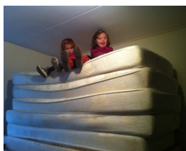
We konden dit jaar nieuwe bedden aanschaffen! Geweldig, dankzij de inzet van vierdaagselopers en een bijdrage van de Soroptimisten. De oude matrassen werden opgeruimd.