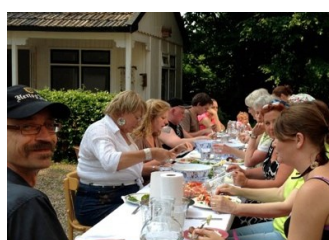
Gezellig samen zijn en samen eten in de mooie tuin. Steun, gezelligheid en warmte ondervinden aan elkaar.