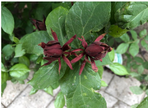
Bloeiende plant in de tuin