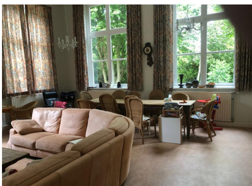
Huiskamer in Het Tweede Huis