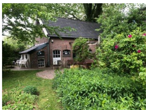
Boerderijtje met tuin en terras

Stichting Het Tweede Huis Kerklaantje 10 6612 BB Nederasselt 024-6221281 www.stichtinghettweedehuis.nl info@stichtinghettweedehuis.nl Rabobank: NL39RABO 01586.69.916 ING: NL26 INGB 0006240047 ANBnummer: 3300