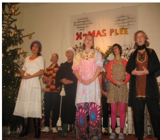
Tijdens de kerstviering een prachtig optreden van medewerkers, bewoners en oud-bewoners van het Tweede Huis

Spelend Zingen is wat we doen in het Tweede Huis op de maandag middag.